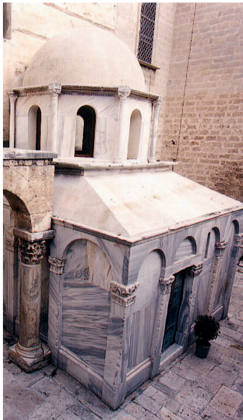
La tomba di Boemondo d'Altavilla

La vita di Boemondo principe di Antiochia scorre come in un film diviso in tre tempi: «Il primo - spiega Russo nel libro - nelle terre calabro-pugliesi, sullo sfondo delle grandi imprese del Guiscardo, dove il nostro eroe diventò principe di Taranto e signore di Bari; il secondo, dominato dallo scenario esotico e drammatico della prima Crociata sulla quale Boemondo si impose come l'attore più rappresentativo e spettacolare, che gli altri sovrastò fin dalle prime battute del copione, non solo in altezza, ma di gran lunga il più abile dei comprimari sulla scena per carattere e personalità .... Il terzo tempo, quello affidato ai posteri, quando ormai l'orologio senza lancette della storia, segna il